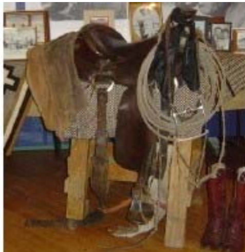
馬用の鞍、ブーツ、ロープ