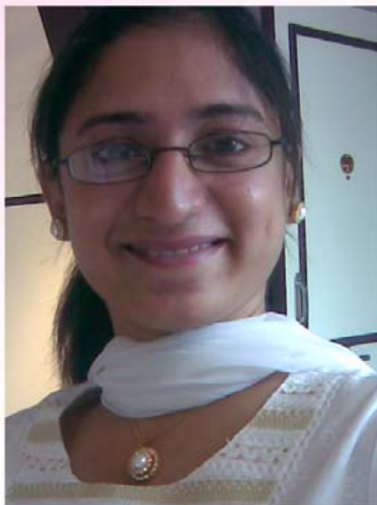
アルティ ウムロトウカル (インド)

Welcome and join here (timings: 4.30pm to 6pm) & Have fun and share with each other